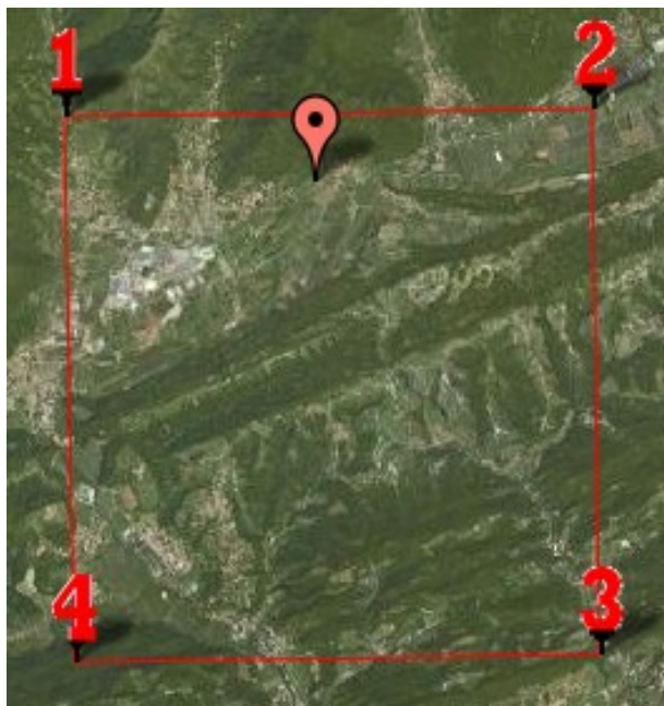
Elementi di amplificazione topografica: categoria T1 (da Di Bucci et al. 2005)

Ubicazione nel reticolo di riferimento sismico individuato dalla O.P.C.M. 28-04-2006 n. 3519